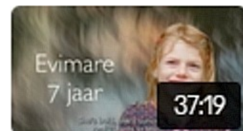
Diagnosis Angelman 456

De video Het succes van OC is in 9 talen ondertiteld: NL, ENG, FR, DK, NO, PL, RO, RU, SE, UA.