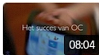
Het succes van OC 690