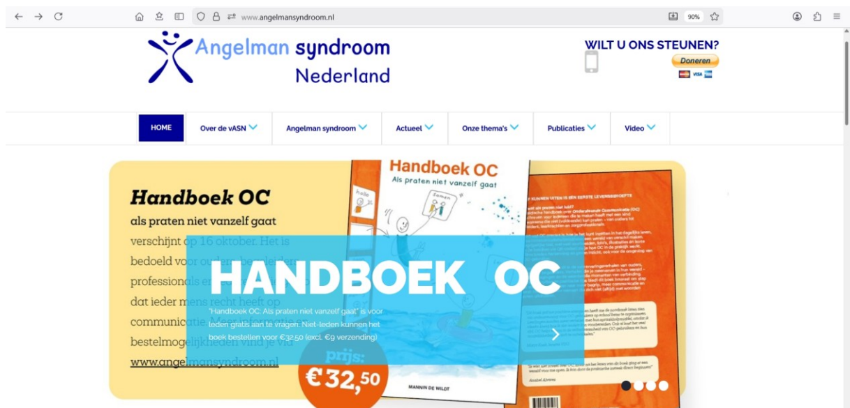
Deel van de openingpagina van de website van de vASN in 2025