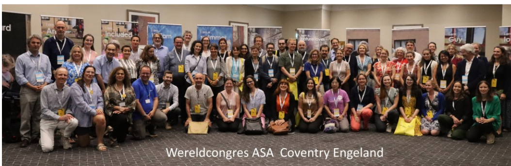
Wereldcongres ASA Coventry Engeland