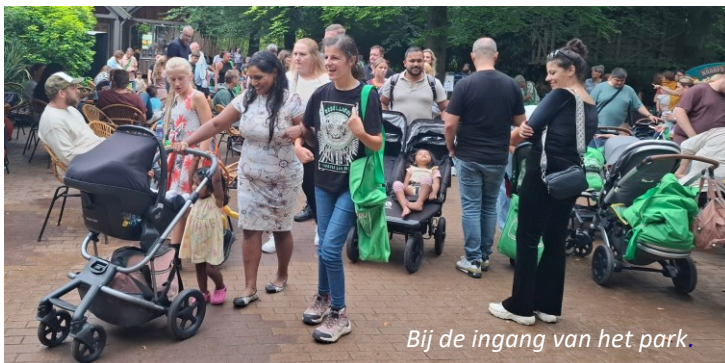
Bij de ingang van het park.

De zon lachte onze leden en hun familie bij binnenkomst toe. De aapjes toonden af en toe hun sterke belangstelling voor de eigendommen van de bezoekers. Na de lunch echter begon het fors te regenen bij het voeren van de gorilla's en kwam er voor sommige bezoekers een vroegtijdig einde aan een mooie dag.