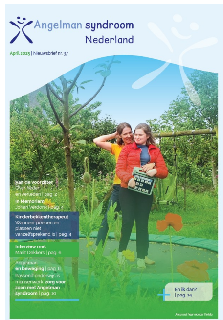
Cover nieuwsbrief nr. 37

De twee uitgebreide nieuwsbrieven zijn opgemaakt door Studio-Pimp ( https://studiopimp.nl/ ). RDS-Repro uit Odijk ( https://rds.nl/ ) verzorgde het drukwerk en de verzending per post voor een aantrekkelijk tarief.