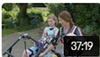
Diagnose Angelman 824

De meest bekeken video's (met hun aantal) in 2025 zijn: