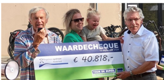
Een wielerevenement van de fa. Bunzl leverde € 40.818 op voor onderzoek